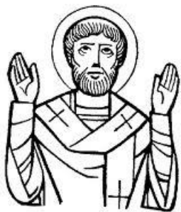
SAN MARTINO I papa e martire